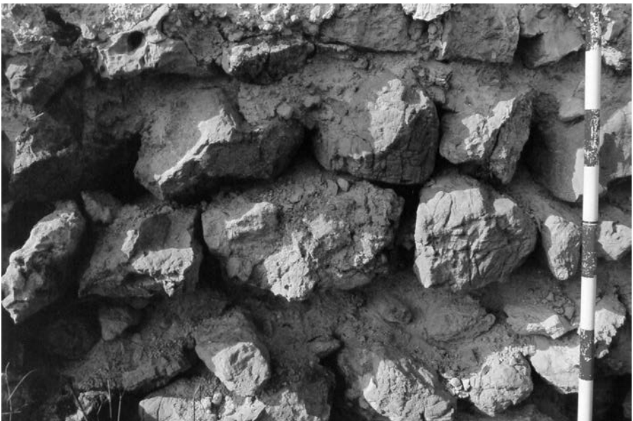
FIGURA 4. Mur que divideix la torre i l'església (materials emprats en la seua construcció).