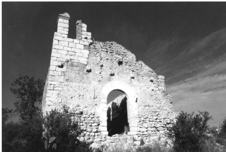
FIGURA 1. Façana principal.