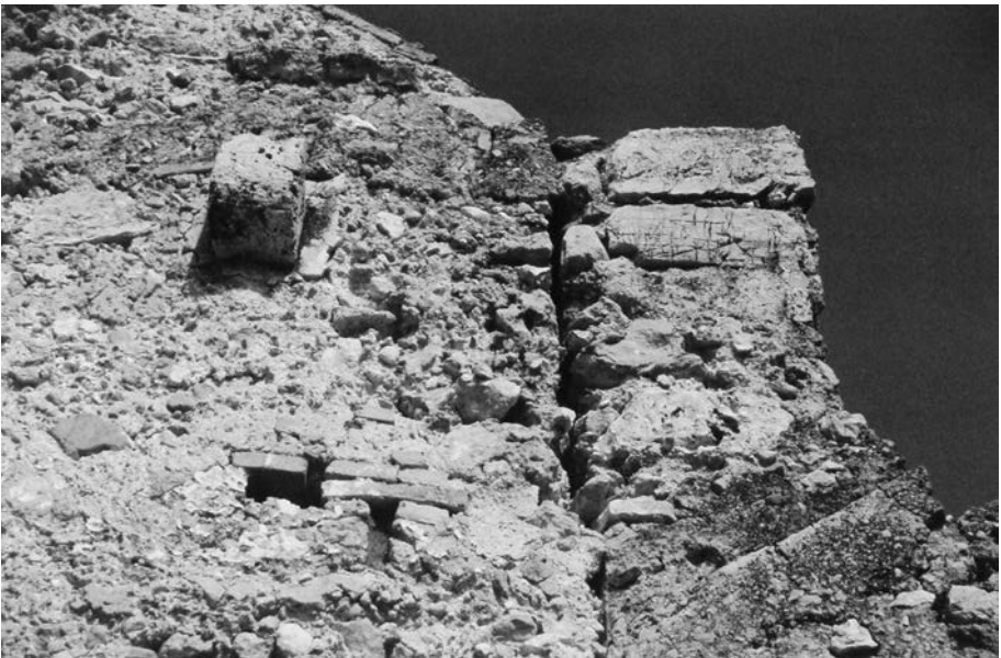
FIGURA 8. Mur del temple adossat a la torre.