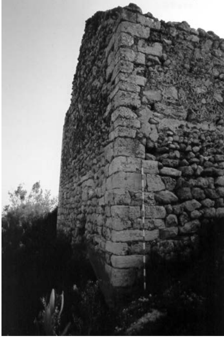
FIGURA 5. Carreus. Vista posterior del temple.