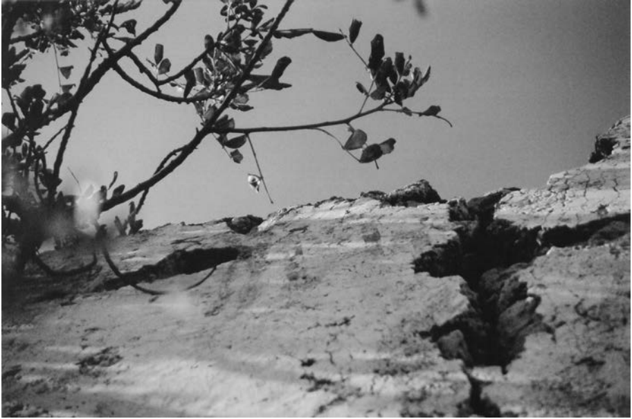
FIGURA 3. Interior del temple. Mur lateral esquerre. Lletres pintades.