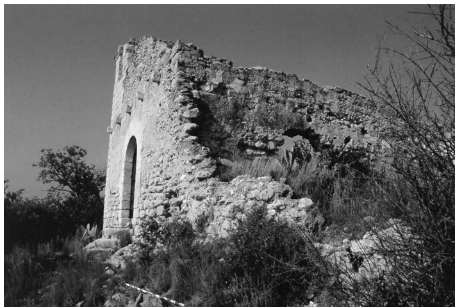
FIGURA 2. Església i torre.