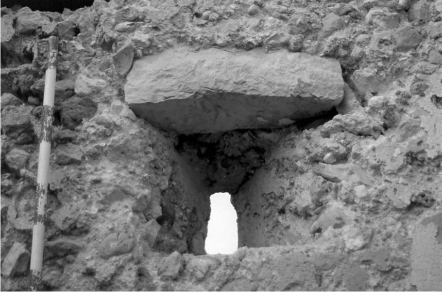
FIGURA 7. Espitllera.