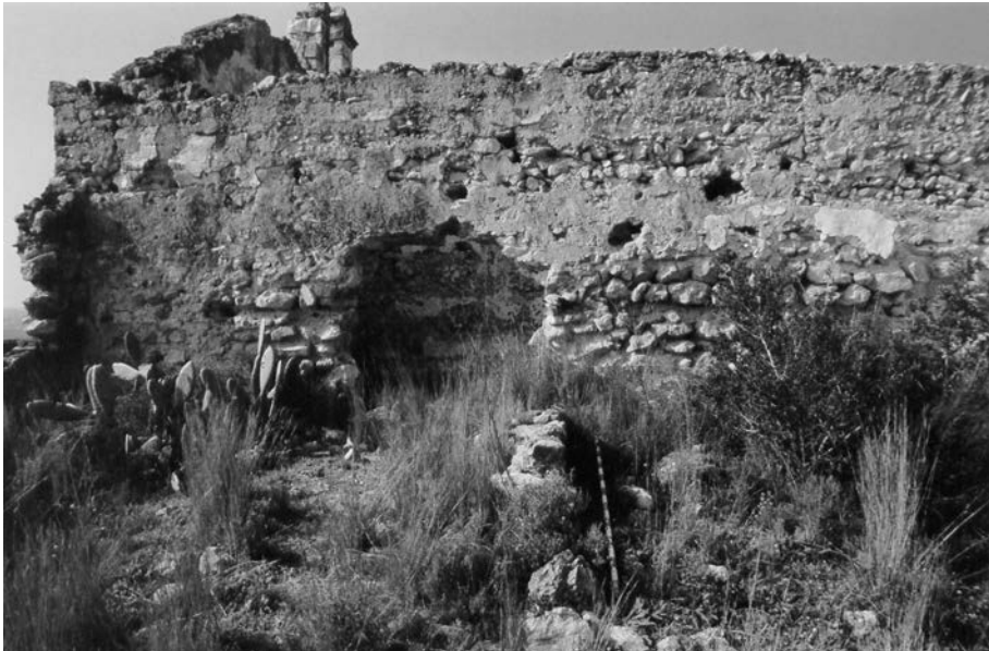
FIGURA 6. Restes de la torre (posterior de la casa de l'ermità). Mur diafragma central.